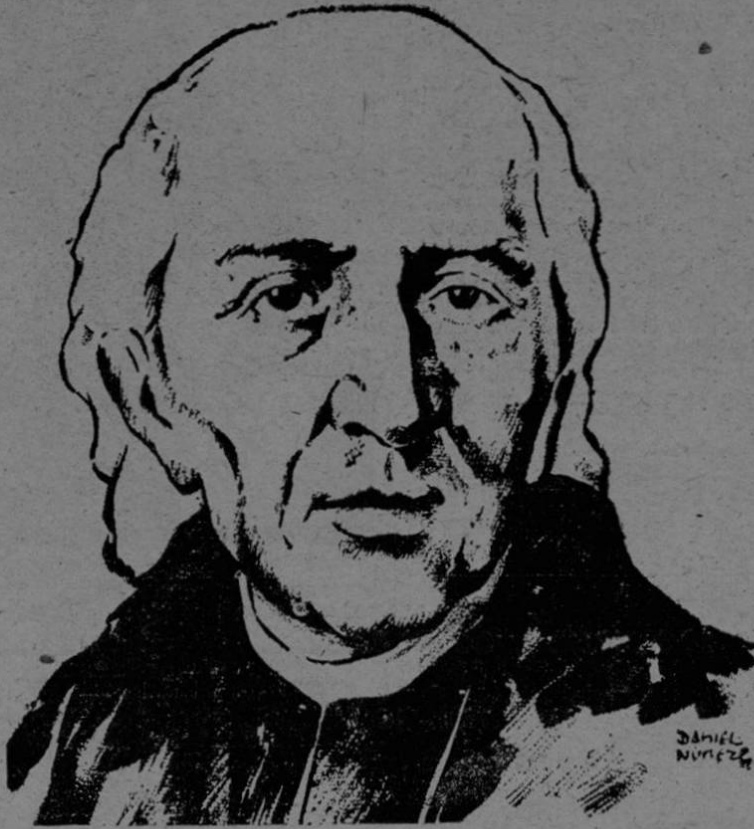
El Padre Miguel Hidalgo y Costilla